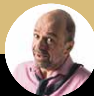
Thilo Seibel